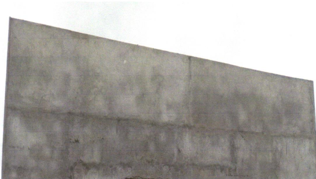
FOTO03- MASSA ÚNICA, PARA RECEBIMENTO DE PINTURA, EM ARGAMASSA TRAÇO 1:2:8, PREPARO MANUAL, APLICADA MANUALMENTE EM FACES INTERNAS DE PAREDES, ESPESSURA DE 10MM, COM EXECUÇÃO DE TALISCAS. AF_06/2014