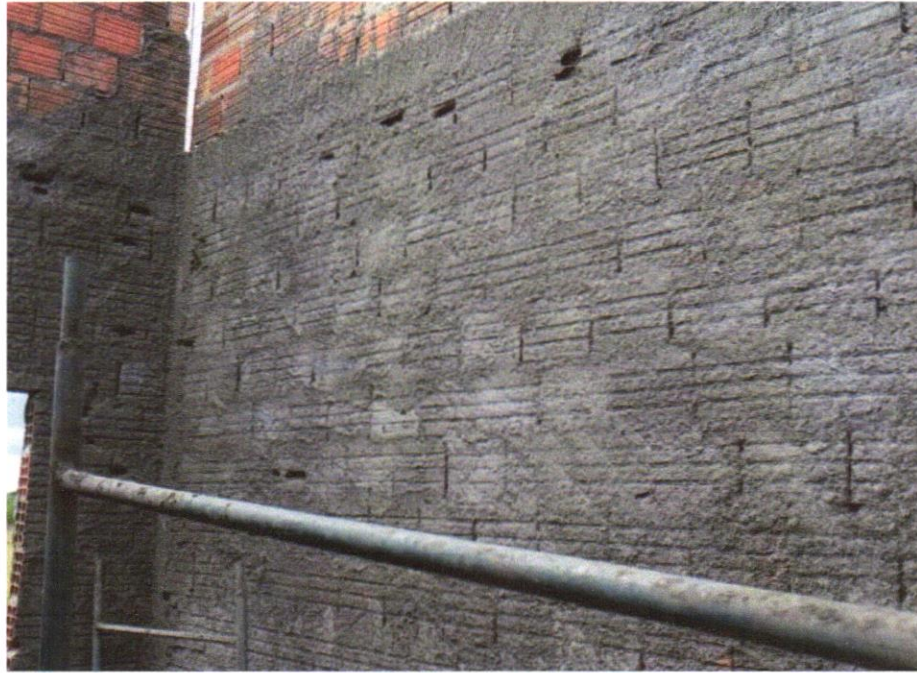
FOTO 07 - CHAPISCO APLICADO EM ALVENARIAS E ESTRUTURAS DE CONCRETO INTERNAS, COM COLHER DE PEDREIRO. ARGAMASSA TRAÇO 1:3 COM PREPARO EM BETONEIRA 400L. AF_06/2014