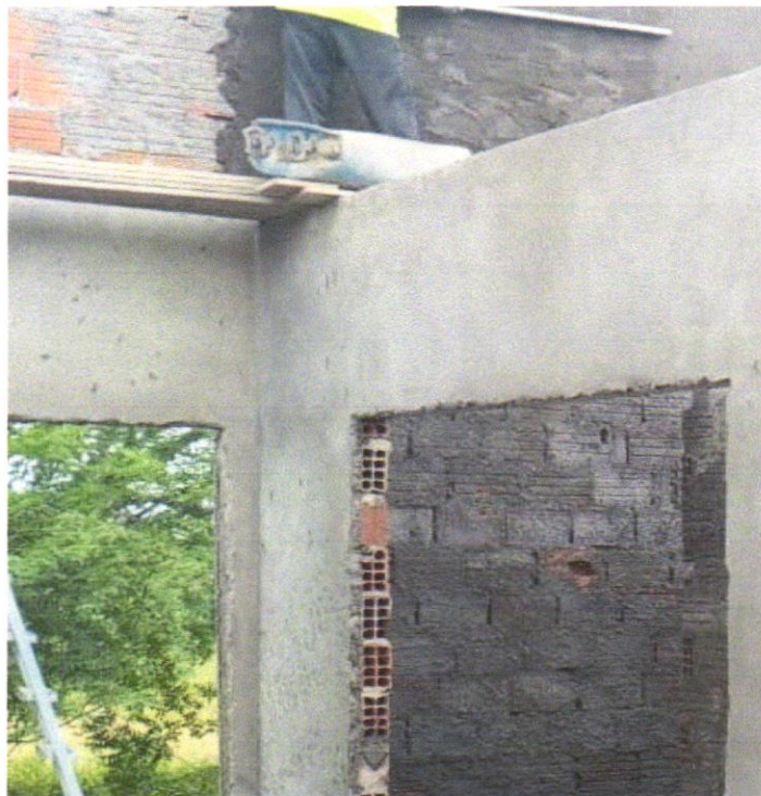
FOTO 05—CHAPISCO APLICADO EM ALVENARIAS E ESTRUTURAS DE CONCRETO INTERNAS, COM COLHER DE PEDREIRO. ARGAMASSA TRAÇO 1:3 COM PREPARO EM BETONEIRA 400L. AF_06/2014