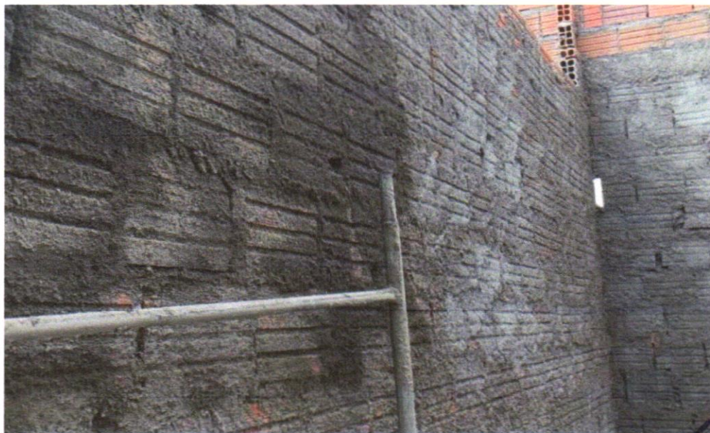
FOTO 08 - CHAPISCO APLICADO EM ALVENARIAS E ESTRUTURAS DE CONCRETO INTERNAS, COM COLHER DE PEDREIRO. ARGAMASSA TRAÇO 1:3 COM PREPARO EM BETONEIRA 400L. AF_06/2014