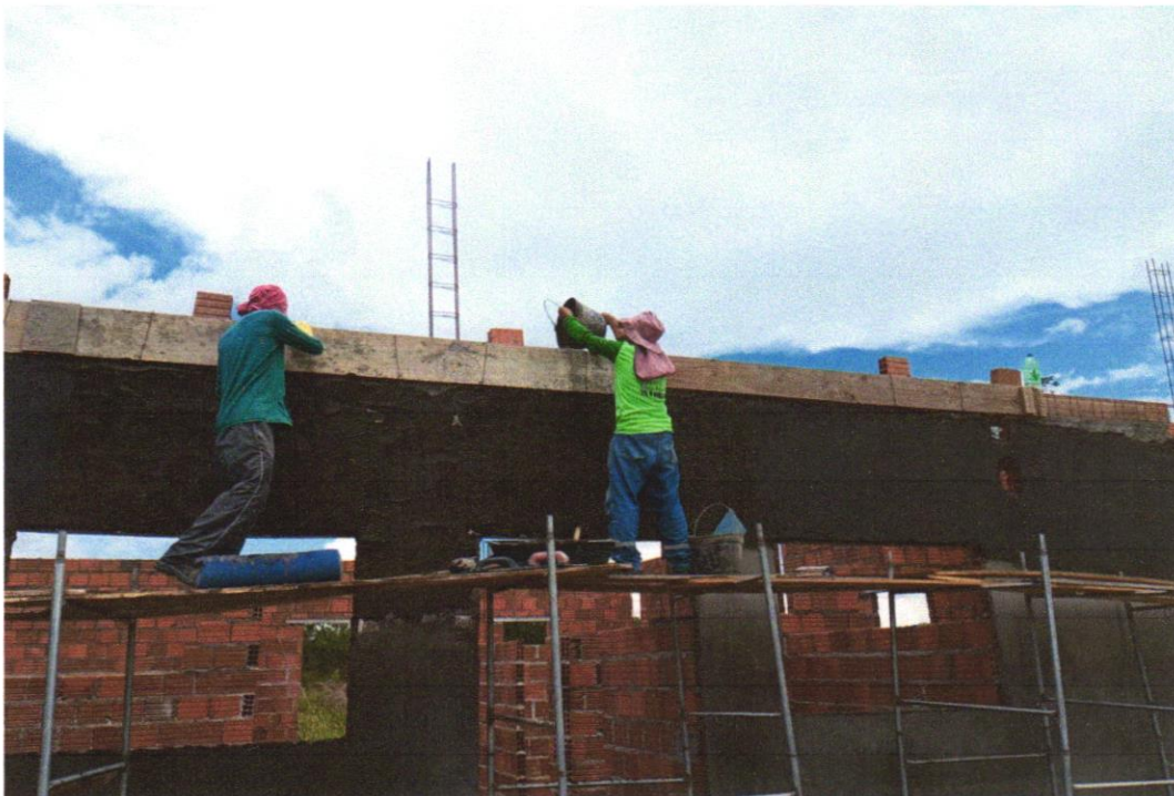
FOTO 09 – (COMPOSIÇÃO REPRESENTATIVA) EXECUÇÃO DE ESTRUTURAS DE CONCRETO ARMADO, PARA EDIFICAÇÃO HABITACIONAL UNIFAMILIAR TÉRREA (CASA EM EMPREENDIMENTOS), FCK = 25 MPA. AF_01/2017