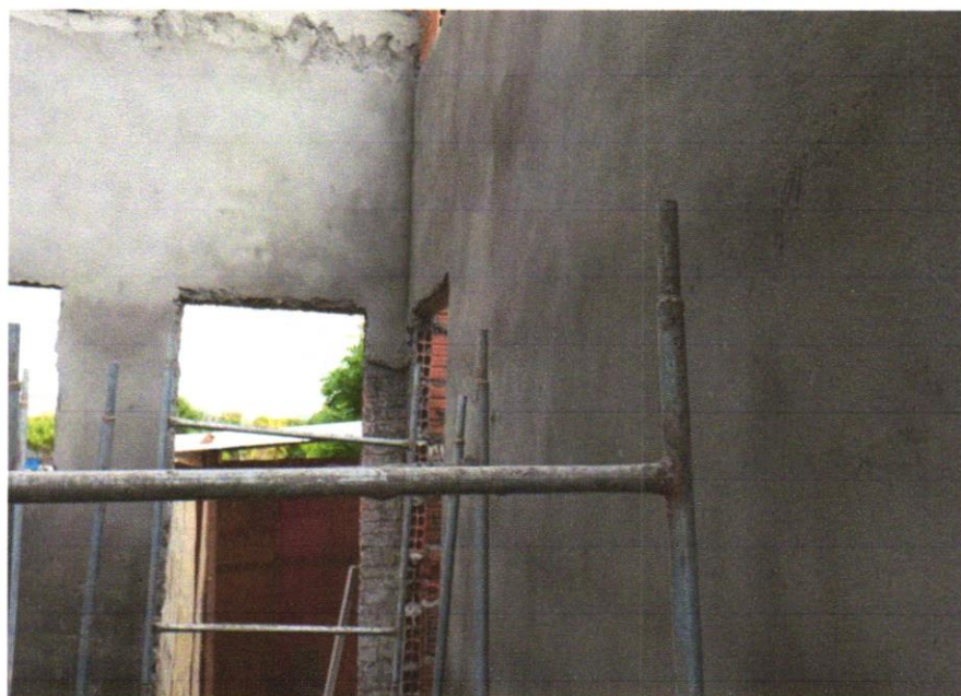
FOTO 01 – MASSA ÚNICA, PARA RECEBIMENTO DE PINTURA, EM ARGAMASSA TRAÇO 1:2:8, PREPARO MANUAL, APLICADA MANUALMENTE EM FACES INTERNAS DE PAREDES, ESPESSURA DE 10MM, COM EXECUÇÃO DE TALISCAS. AF_06/2014